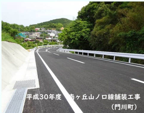
平成30年度 南ヶ丘山ノ口線舗装工事 (門川町)