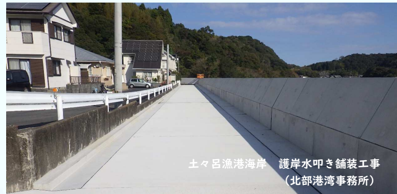
土々呂漁港海岸 護岸水叩き舗装工事 (北部港湾事務所)