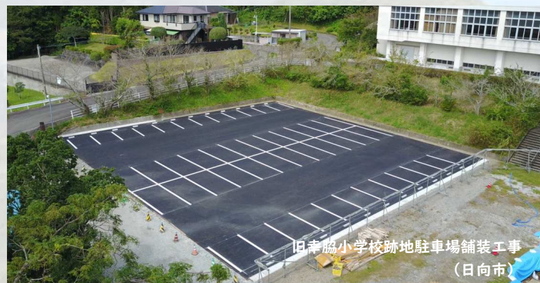
旧幸脇小学校跡地駐車場舗装工事 (日向市)