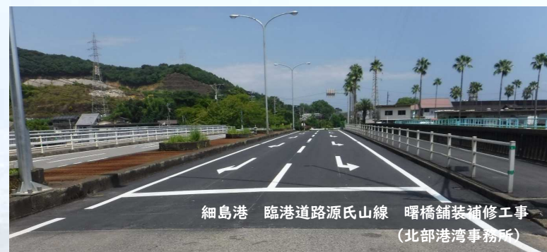
細島港 臨港道路源氏山線 曙橋舗装補修工事 (北部港湾事務所)