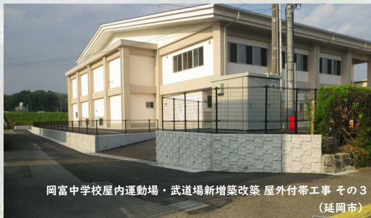
岡富中学校屋内運動場・武道場新增築改築 屋外付帯工事 その3 (延岡市)