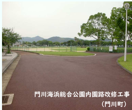
門川海浜総合公園内園路改修工事 (門川町)