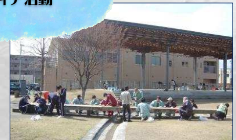
日向市駅 美化活動