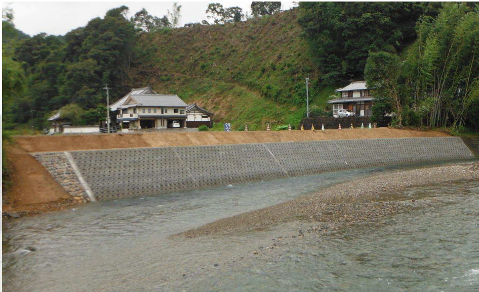
細見川河川災害復旧工事（延岡土木事務所）

外で行う仕事のためキツイ季節もありますが、道路を造り、守り、地域貢献できるやりがいのある仕事です。