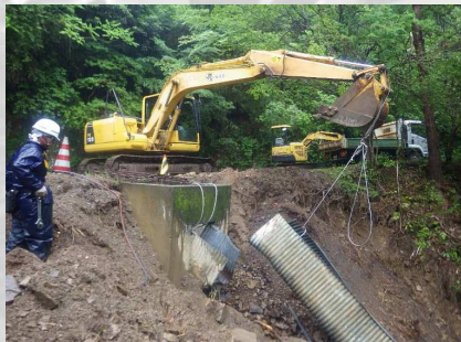
台風による災害【土砂崩れ】 （門川町）