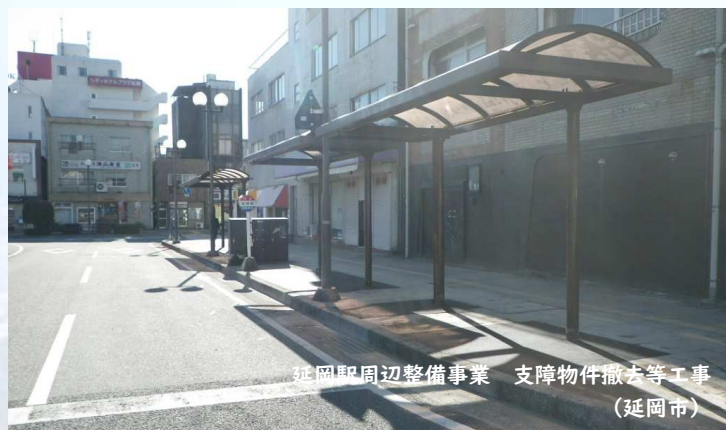
延岡駅周辺整備事業 支障物件撤去等工事 (延岡市)