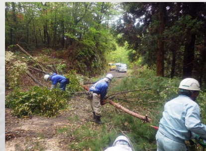
台風による災害【倒木撤去】 （門川町）